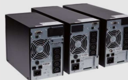
Modelos LBT con autonomía personalizable

Estas especificaciones pueden cambiar sin previo aviso