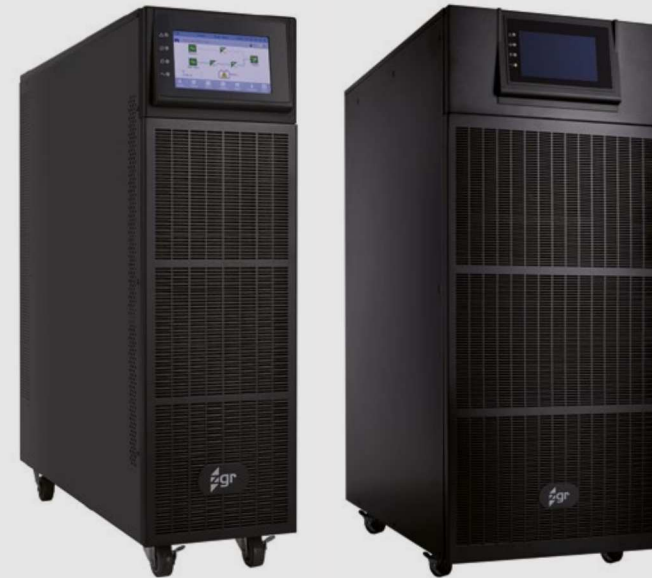
HP 50 - 60

Están disponibles en versión de Doble Entrada que permite tener una red auxiliar de bypass trifásica.